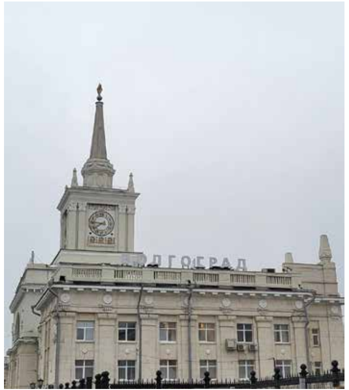
Вакзал у Валгаградзе.

Больш за ўсё запомніўся апошні дзень: мы пльылі эстафеты 4x100 вольным (кролем) стылем. І нягледзячы на тое, што я перажывала і падтрымлівала каманду БДУ, мне запомніўся апошні заплыв. У ім бралі ўдзел наймацнейшыя расійскія ВНУ і наша - БДУФК. Памятаю, як трэнера і каманды бегалі па борціку, свісталі і крычалі, калі пачаўся апошні этап і пльуіцы ішлі на ўзроўні. Радасныя крыкі: «Бе-ла-русь, Бе-ла-русь...», калі ў эстафеце выйграў дотык БДУФК. Гэта