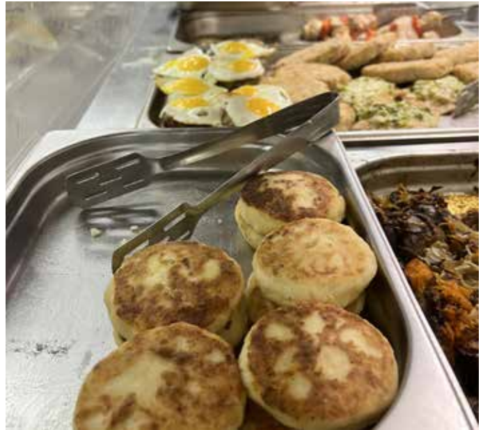
Еда в столовой.

С ытный студент – довольный студент. Поэтому работники столовой в здании нашего журфака работают, отдавая все свои силы, чтобы желудок каждого посетителя был полным. Столовая №6 работает с 9:30 до 16:00 по будням. Запомните, если не хотите остаться голодными, что санитарный день – вторая пятница месяца!