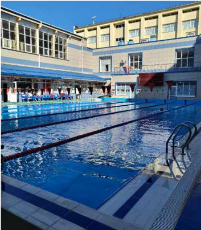
Басейн, у якім праходзілі спарторніцтвы.