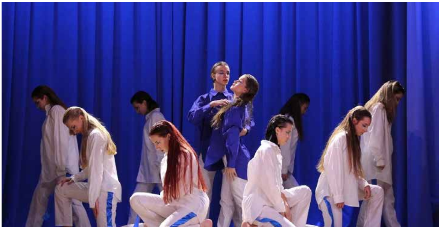
Команда журфака «сМЫсл». Фото: Фото: vksom/УФМ – фестиваль первокурсников БГУ