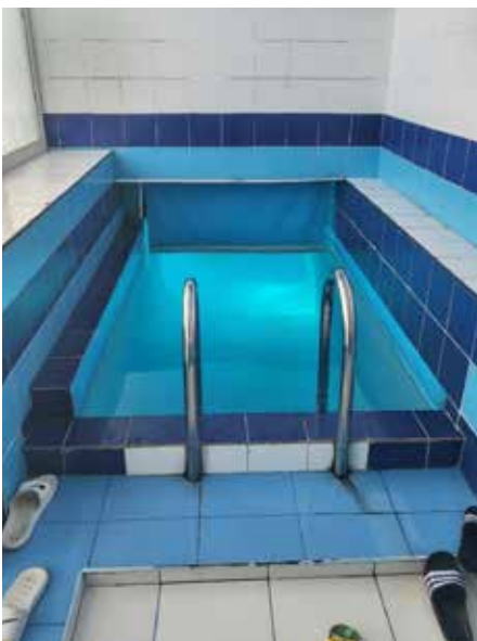
Уваход у басейн.

Апроч усяго ў нас была і культурная праграма. Мы наведалі экскурсію па Мамаевым кургане, дзе падняліся да помніка Радзіме-маці, і аглядалі панараму Сталінградскай бітвы. Акрамя гэтага пабывалі ў басейне алімпійскай падрыхтоўкі «Искра». Там на экскурсіі нам расказалі, што з Валгаграда выйшла каля 170 алімпійскіх чэмпіёнаў. Спартыўны комплекс мяне ўразіў, мы нават не паспелі поўнаасцю абысці яго. У ім 8 басейнаў (палова з іх – адчыненыя). Каля 4 спартыўных залаў. Ёсць басейн для дзяцей, якія толькі пачынаюць плаваць, з горкамі ў ваду, а таксама для немаўлят. Адрозна да комплексу прыбудаваны гатэль, дзе спартсмены жывуць падчас збораў.