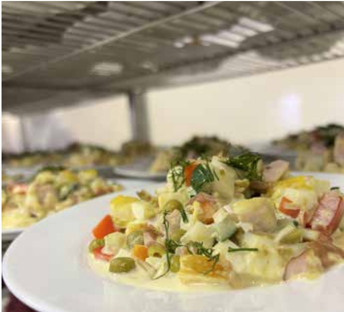
Еда в столовой.

«ЖурФакты» отправились в столовую оценить, соответствует ли она требованиям студентов.