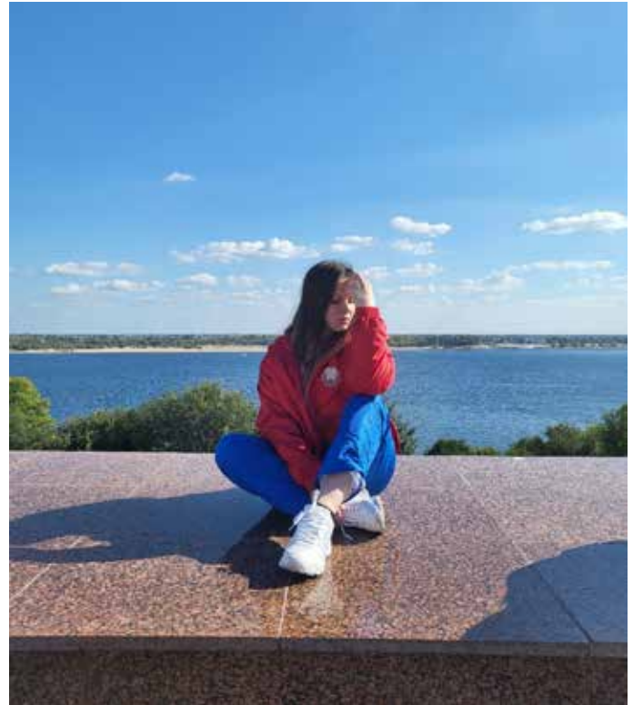
Каля Волгі. Фота аўтара