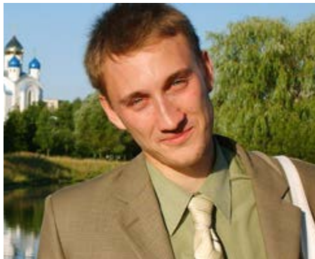
«Недзе ў Мінску»