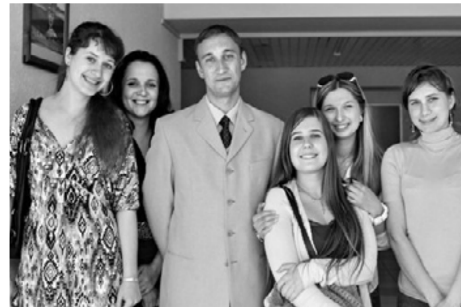
«Студэнты віншуюць з абаронай кандыдацкай»