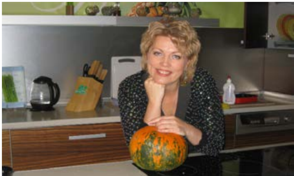
На съемках передачи «Дело вкуса»

– Жизнь подсказывает. Просто нужно быть наблюдательным и небезынициативным. У меня на радио 2 года назад была программа «Самый лучший день». Каждый день нужно было придумывать новую тему, и под рукой всегда находились заголовки статей в газетах и журналах, книги. Общение с друзьями, интернет, sms-опросник на радио – все шло в ход. В журналистике нельзя ничего игнорировать.