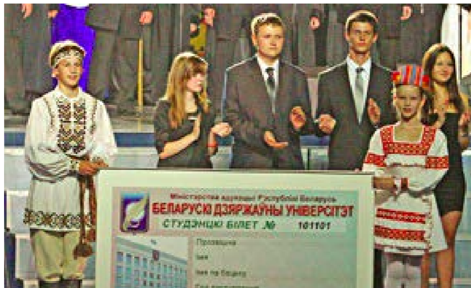
bsu.by. Театрализованное шоу «Виват, студент!»

Конец августа – горячая пора для всех общежитий: отдохнувшие и не очень за лето студенты заселяются в уютные и недорогие по нынешним меркам комнаты сроком ровно на учебный год. Правда, пока «избранные» привыкают к жилищным условиям общаги, другие снимают квартиру... И абсолютно не представляют, как за нее платить.