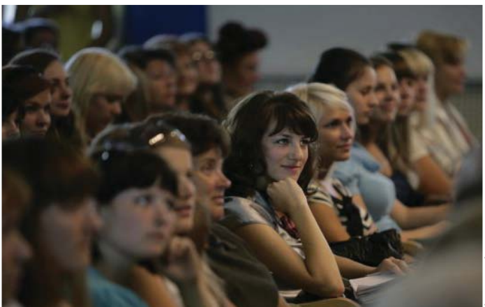
Арт. Я. Шурко / www.oiof