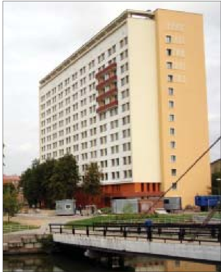
фото студентки Зельки